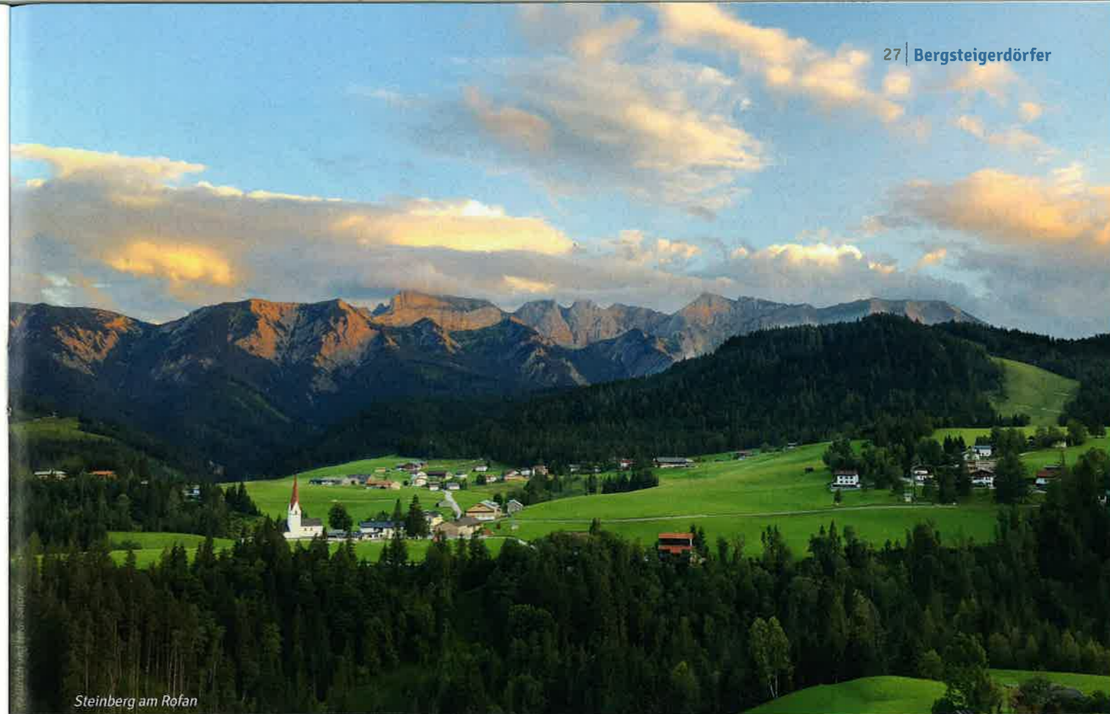
Steinberg am Rofan

Nähere Infos zu allen Bergsteigerdörfern sind auf der Webseite www.bergsteigerdoerfer.org zu finden. Broschüren zu den neuen Bergsteigerdörfern liegen in der Geschäftsstelle des Alpenverein Austria auf oder sind auf Bestellung bei info@bergsteigerdoerfer.org erhältlich. (Broschüren Triora und Balme derzeit nur in italienischer Sprache erhältlich).