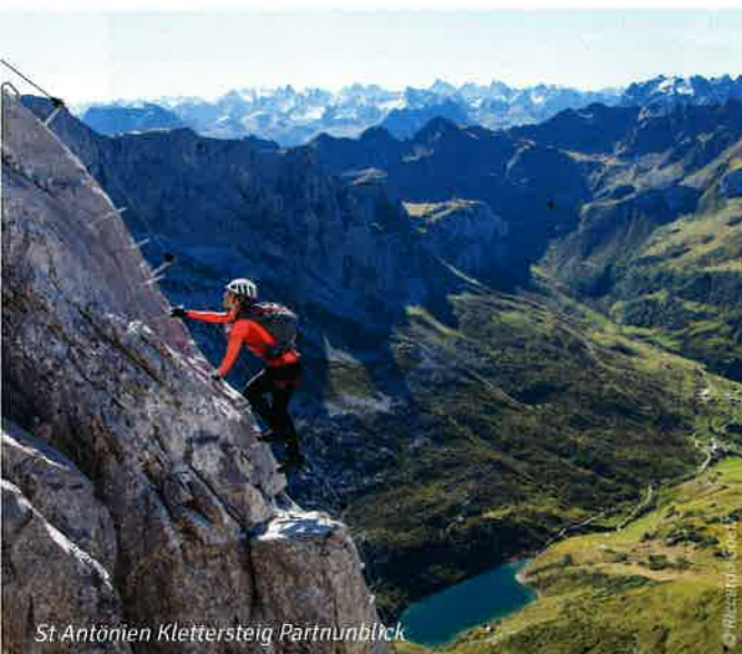
St. Antonien Klettersteig Partnurblick